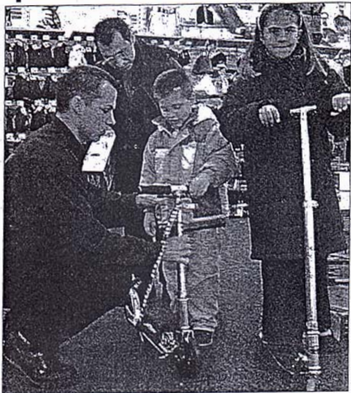
Quinze stands seront consacrés à la grande distribution.

Plus concrètement encore, « on fait tout pour que les moins favorisés puissent venir » : entrée gratuite, demi-tarif SNCF, gratuité des